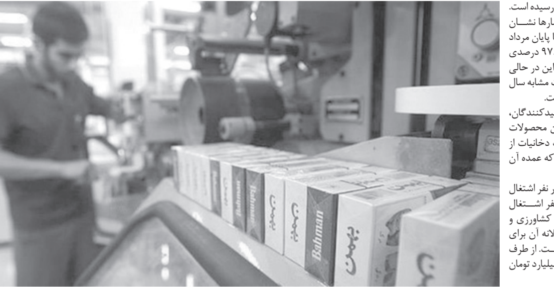
نخ سیگار در مدت مشابه امسال رسیده است.