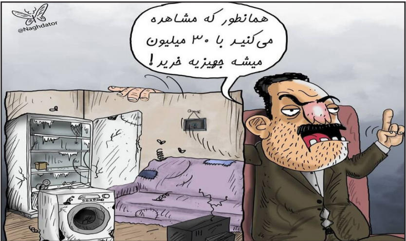
دبیر اتحادیه لوازم خانگی گفته کف قیمت جهیزیه تمام ایرانی حدود ۳۰ میلیون تومان است