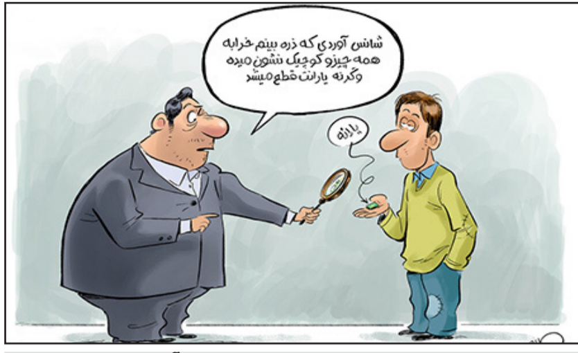
ماموران مالیات در حال پیدا کردن پردرآمدها