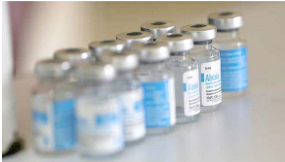
شرکت کوبایی داروسازی بایوکوفارما اعلام کرد، نیکاراگوئه مجوز استفاده

اضطراری دو واکسن ویروس کرونای ساخت کوبا را صادر کرده است. به نقل از رویترز، شرکت کوبایی داروسازی بایوکوفارما روز شنبه اعلام کرد، نیکاراگوئه مجوز استفاده اضطراری دو واکسن ویروس کرونای ساخت کوبا را صادر کرده است. شرکت دارویی بایوکوفارما در حساب کاربری خود در شبکه اجتماعی توئیتر نوشته است، سازمان تنظیم سلامت نیکاراگوئه مجوز استفاده اضطراری برای واکسن‌های آبدالا و سوبرانا را صادر کرده است. دانشمندان کوبا سه واکسن علیه کووید ۱۹ تولید کرده‌اند که همه آنها در انتظار تایید رسمی سازمان جهانی بهداشت هستند. کوبا اولین کشور در آمریکای لاتین و کارائیب است که موفق به تولید واکسن علیه کرونا شده است. ونزوئلا، ویتنام و ایران نیز مجوز اضطراری برای استفاده از واکسن‌های کوبا را صادر کرده‌اند.