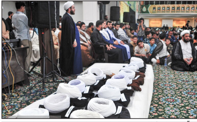
آیین عمامه گذاری جمعی از طلاب در یادمان شهید علی هاشمی