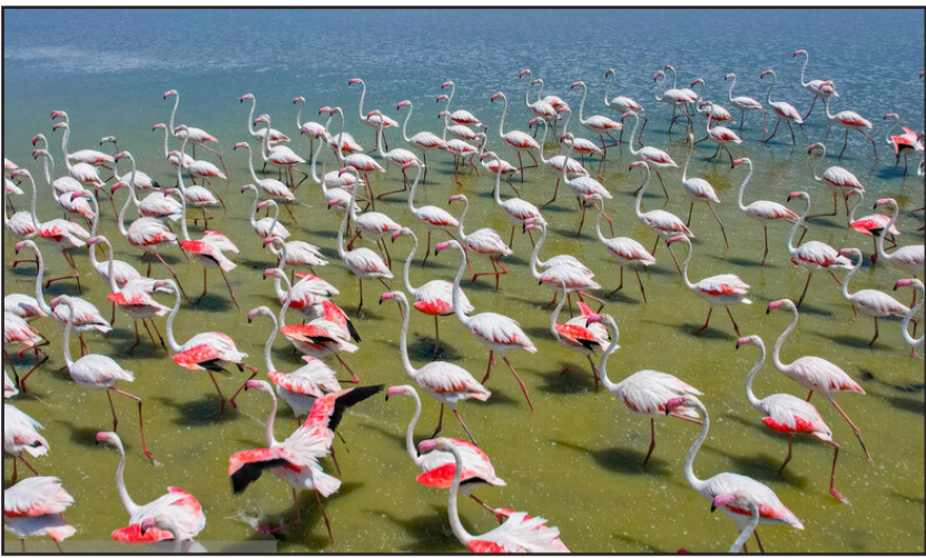
تالاب سئیران گولی میزبان ۱۰ هزار فلامینگو