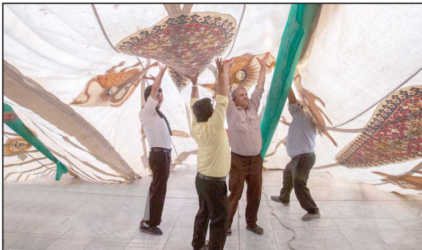
برپایی خیمه سیدالشهداء در صحن امامزاده موسی مبرقع (ع)