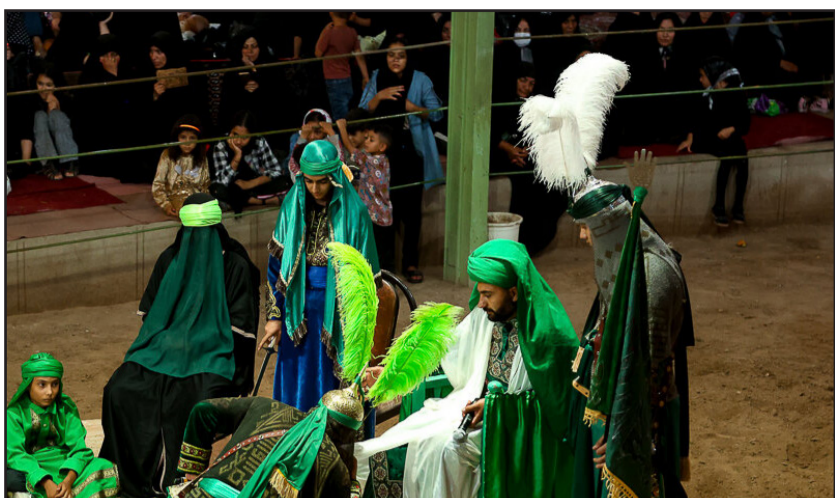
مراسم تعزیه خوانی - قزوین