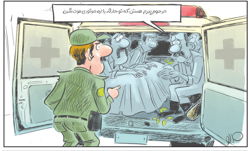
جدیدترین روش قاچاق چوب رو ببینید!