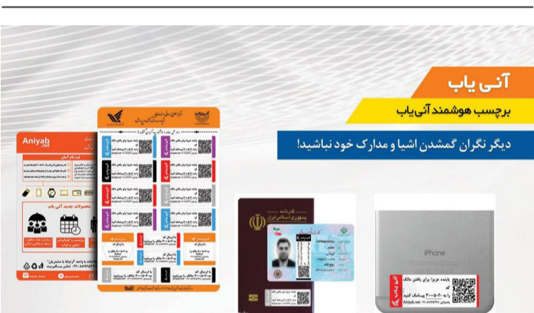
برجسب های هوشمند آن‌یاب در سیزدهی مختلف، به منظور چسبیدن روی اشیا و مدارک، جهت سریع‌تر پدیدکردن کمک توسط یاننده‌های فراری و تولید شده اند.این برجسب‌ها دارای کدهای متضربه‌اند.فرد در هر حثیت بوده‌که با فاسترآی آنها و چسبیدن روی اشیا و مدارک ، در صورت مفقود شدن و پیدا شدن توسط هر شخص ، با استفاده از SMS (پیامک ) ، اسکن بارکودتاس یا با پیش‌بینی دفتر مرکزی آن‌یاب امکان تحول سریع‌ش، یا مدارک یا فکته‌شده به کمک آن فراهم میگردد.