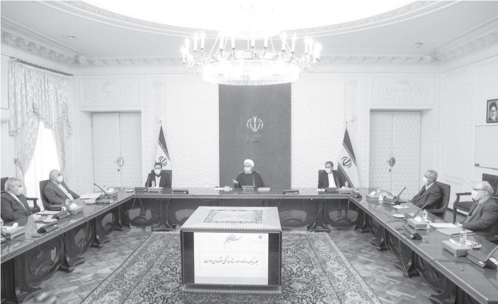
دیدگری از این جلسه با اشاره به تجارب به دست آمده از خلال سه سال مقابله با جنگ تحمیلی اقتصادی گفت: دولت با تکیه بر