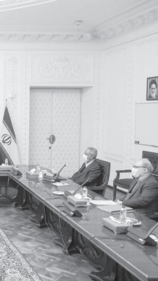
دیداری از این جلسه با اشاره به تجارب به