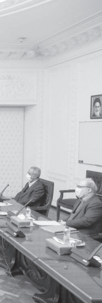
دیدار رییس‌جمهوری با اعضای ستاد

رییس جمهوری گفت: دولت امیدوار است با اقدامات انجام گرفته در هفته‌های آینده با خرید واکسن و انتقال آن به داخل کشور، واکسیناسیون بر اساس اولویت‌بندی و جدول آماده شده از جامعه هدف در کشور با اولویت کادر درمانی و سالمندان آغاز شود. سستاد هماهنگی اقتصادی دولت که به ریاست حجت الاسلام والمسلمین حسن روحانی بر گزار شد، وزارت بهداشت، درمان و آموزش پزشکی و بانک مرکزی از فعالیت‌ها و اقدامات انجام گرفته در تأمین منابع و خرید واکسن کرونا از تولیدکنندگان مختلف در خارج از کشور، گزارش‌هایی ارائه کردند. رییس جمهوری با تأکید بر لزوم تسریع در اقدامات و فعالیت‌های انجام گرفته در این زمینه تصریح کرد: بانک مرکزی، وزارت امور خارجه و سازمان برنامه و بودجه باید در کنار وزارت بهداشت که مسئول دقت‌های لازم کارشناسی است، به گونه‌ای برنامه ریزی کنند که خرید و انتقال واکسن به کشور سریع‌تر به سرانجام برسد. روحانی در بخش