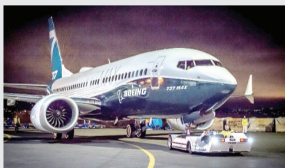
اعلام می‌شود که اداره هوانوردی فدرال آمریکا (افای‌ای)