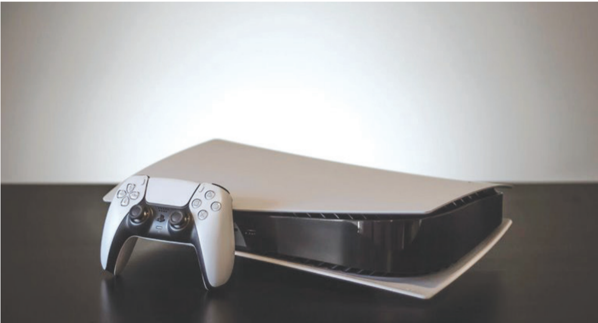
پلی استیشن ۵ در کنار کنترلر DualSense Wireless

کنسول پلی استیشن ۵ از نرخ نوسازی متغیر پشتیبانی نمی‌کند؛ اما طبق اعلام رسمی سونی، این قابلیت به‌زودی ازطریق به‌روزرسانی نرم‌افزاری به کنسول مورد بحث خواهد آمد. پس از مدت‌ها انتظار، سرانجام عرضه‌ی رسمی کنسول‌های نسل نهمی سونی به بازار آغاز شد تا شاهد فصل جدیدی از رقابت سونی و مایکروسافت در دنیای کنسول بازی باشیم. اگر جدیدترین اخبار بازی را در زومجی دنبال کرده باشید، می‌دانید پلی استیشن ۵ تنها پس از گذشت چهار روز از زمان عرضه در کشور ژاپن، توانست نزدیک به چهار برابر ایکس باکس‌های جدید فروش کند. پلی استیشن ۵ با وجود داشتن مزیت‌های متعدد، محدودیت‌هایی برای کاربران خود ایجاد کرده است. یکی از این محدودیت‌ها عدم پشتیبانی از فناوری نرخ نوسازی متغیر (Variable Refresh Rate) است. به نظر می‌رسد کاربران پی اس ۵ نباید زیاد نگران این موضوع باشند؛ زیرا سونی به‌صورت رسمی تأیید کرد قابلیت مور بحث به‌زودی با به‌روزرسانی نرم‌افزاری به پلی استیشن ۵ اضافه می‌شود.