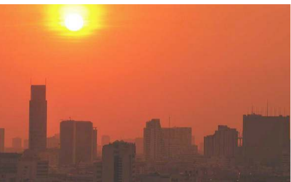
روزنامه ایرورز در یک روز در تهران

بررسی‌های یک مطالعه نشان داد که دمای هوای تهران در سال ۱۳۹۷ نسبت به ۱۳۶۷ حدود یک درجه و میانگین دمای سطح زمین در این بازه زمانی بیش از دو درجه سانتی‌گراد افزایش یافته و وسعت پوشش گیاهی در سطح شهر ۶٫۸ درصد کاهش پیدا کرده است. در گزارش اخیر هیات بین‌المللی تغییر آب‌وهوا در اکتبر ۲۰۱۸ عنوان شده که دمای جهانی در سال ۲۰۱۷ نسبت به پیش از انقلاب صنعتی در حدود یک درجه سانتی‌گراد افزایش یافته است. به طوری که در برخی از مناطق و در برخی فصول این افزایش بیشتر از میزان متوسط دما بوده است. در این میان شهرها در کانون چالش تغییرات آب‌وهوا قرار دارند. ایجاد جزایر گرمایی در شهرها و دماهای بالای ناشی از شهرنشینی در مناطق انبوه شهری، از مخاطرات قابل توجه در شهرها هستند.