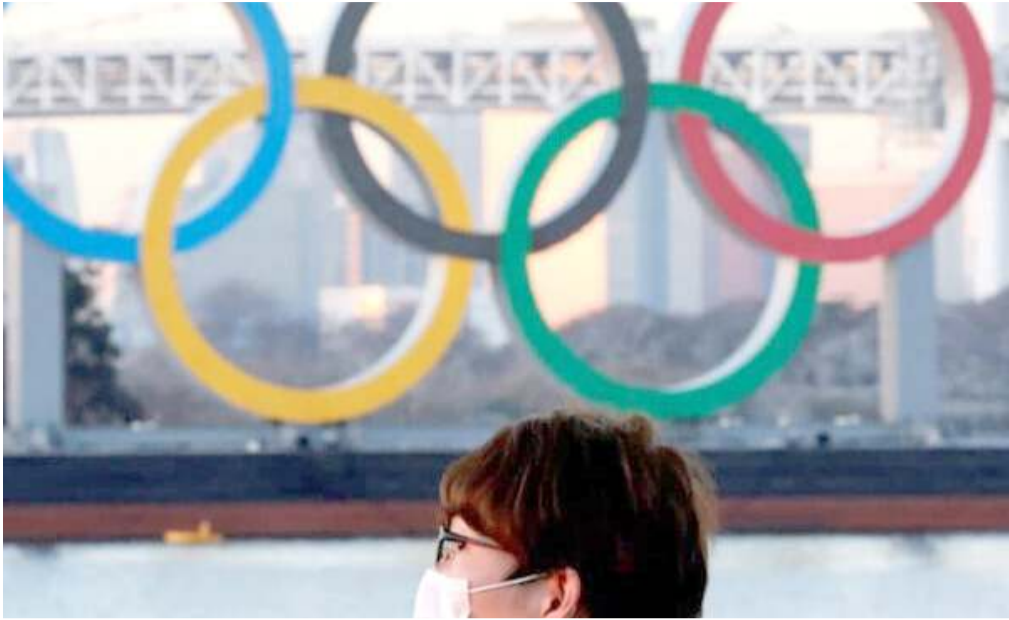
کمیته بین‌المللی المپیک

«میهمانان» مهم‌ترین مسئله قابل تامل در دستورالعمل جدید کمیته بین المللی المپیک است که هفته گذشته برای ایران ارسال شد.