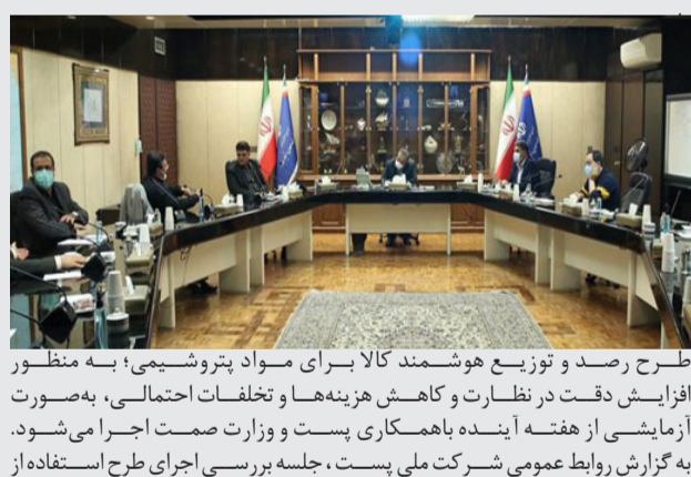
طرح رصد و توزیع هوشمند کالا برای مواد پتروشیمی؛ به منظور افزایش دقت در نظارت و کاهش هزینه‌ها و تخلفات احتمالی، به‌صورت آزمایشی از هفته آینده با همکاری پست و وزارت صمت اجرا می‌شود. به گزارش روابط عمومی شرکت ملی پست، جلسه بررسی اجرای طرح استفاده از

شبکه رصد و توزیع هوشمند کالا توسط پست برای توزیع مواد پتروشیمی بعد از ظهر امروز بیستم مرداد ۱۴۰۰ به ریاست وزیر صنعت، معدن و تجارت و با حضور مدیرعامل شرکت ملی پست و معاون فنی و بازرگانی این شرکت برگزار شد. در این نشست استفاده از ظرفیت‌های شبکه پستی کشور در رصد و توزیع هوشمند کالا برای مواد پتروشیمی مورد بررسی قرار گرفت. بر اساس این گزارش شرکت ملی پست با استفاده از امکانات و ظرفیت‌های الکترونیکی رهگیری و رهسپاری خود و بدون استفاده از تجهیزات حمل و نقل و نیروی انسانی، امکان رصد برخط کالا در شبکه توزیع را فراهم آورده است. بهره‌گیری از سامانه -رصد هوشمند توزیع کالا- که توسط شرکت ملی پست ارائه شده است، علاوه بر افزایش دقت در نظارت بر شبکه توزیع موجب کاهش هزینه‌های نظارت خواهد شد. مقرر شد این طرح به صورت آزمایشی از هفته آینده عملیاتی شود. و پس از مرتفع کردن مشکلات احتمالی، بصورت ملی در سراسر کشور اجرا شود. اجرای این طرح در کنار سایر برنامه‌ها و روش‌هایی نظارتی موجب تسهیل نظارت و کاهش تخلفات احتمالی در نظام توزیع می‌شود.