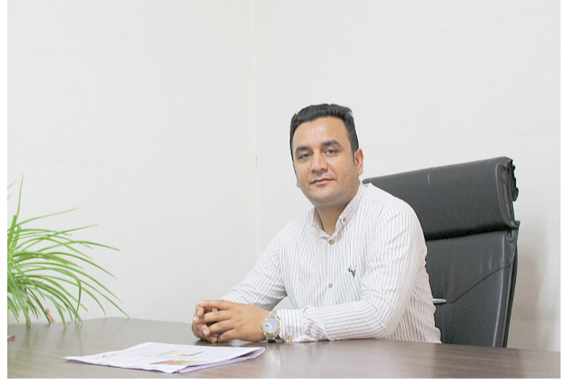
از نظر من وظیفه شناسی یکی از نشانه های مهمی است که در اکثر شغل ها به عنوان معیار موفقیت در نظر گرفته می شود. وظیفه شناسی به احساس تعهد در قبال رعایت کردن حداقل استانداردها و تکمیل وظایف و مسوولیت های شغلی گفته می شود.

به طور مثال یک پرستار باید مهارت ارتباطی خوب، اخلاق مناسب، درک بالا و صبر زیادی داشته باشد و همینطور باید بتواند فشار کاری را تحمل کند و آرامش خود را تحت هر شرایطی حفظ کند. باید دلسوز و مهربان باشد و با بیماران همدردی کند باید کارهای خودش را طبق شرح وظایف انجام دهد و در انجام وظایف خود کوتاهی نکند، مانند حمایت از بیمار و همکاری با سایر اعضای تیم درمان و همچنین در طول شیفت وظایف خود را به موقع شروع و به پایان برساند و به دوش دیگران نیندازد. پرستاران و کادر درمان در هر مقام و موقعیتی که هستند در قبال بیمار بطور مستقیم و غیر مستقیم مسئول خطا های خود میباشند. بنابراین زمانی که یک پرستار وظایف خود را به درستی انجام دهد و در قبال بیماران احساس مسوولیت کند، تا حد زیادی باعث کاهش این خطا ها می شود. ولی با غفلت، عدم مهارت و سهل انگاری در مسیر درمان و مراقبت، باعث خسارت و زرد بیمار می شود. علاوه بر موارد گفته شده همکاری با مسولان هم جز وظایف پرستاران محسوب می شود. و یا زمانی که بیمارستان با کمبود نیروی انسانی مواجه می شود، تا حد امکان برای حل مشکل کمک کند.