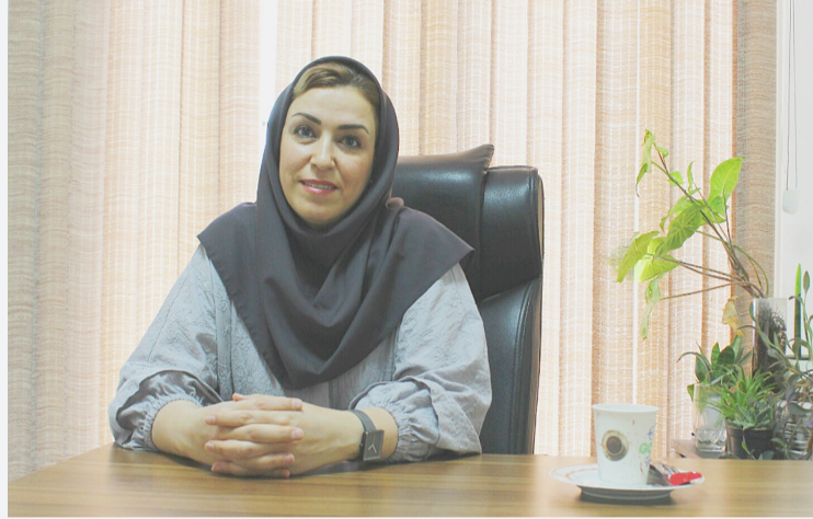
حاصل خواهد شد و بعد از مدتی این یک خاطره خواهد شد.

نمی شود مسلما این افراد در این شرایط فعلی دچار مشکلات می شوند. زمانی که یک دانشجوی پرستاری عاقبت کار خود را در دیگر پرستاران و اطرافیان میبیند که چگونه زیر بار مشکلات هستند. منظوری کمبود نیرو و دانشجویی زیاد است. قطعاً راه حل درست را انتخاب می کند.