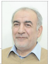
رئیس‌گشایی از نرخ ارز بعد از انتخابات

روزنامه سراسری اقتصادی اجتماعی چهارشنبه ۱۴۰۰/۰۴/۰۲ ۲۰۰۰ تومان شماره: ۱۱۲۲