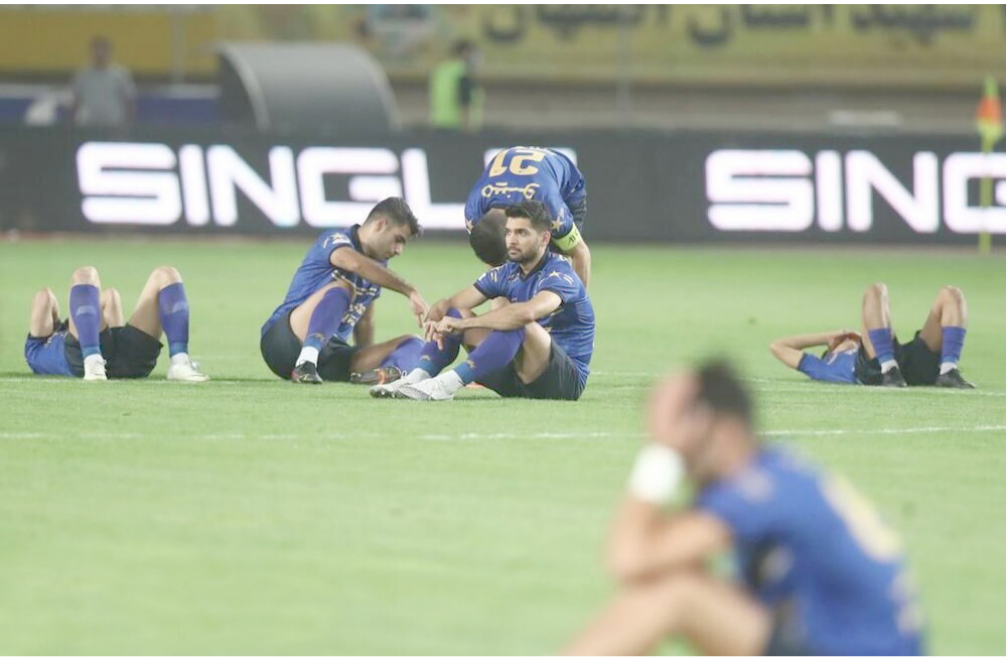
بازیکنان استقلال در حین بازی با پرسپولیس