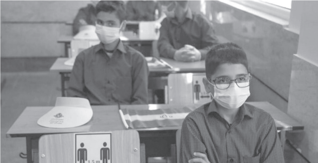
دانش آموزان در کلاس درس