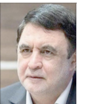
رئیس جمهور برای وزارتخانه‌ها به پایان رسید رئیس جمهور برای وزارتخانه‌ها به پایان رسید

«دولت جدید، فرصت زیادی برای اصلاح امور ندارد و مجلس باید این شرایط را درک کند و اجازه دهد که کارها با هماهنگی دولت و اعمال حداکثری نظرات کارشناسی دولت انجام شود تا بتوانیم از این شرایط فعلی عبور کنیم.»