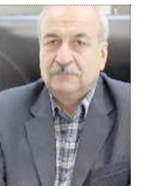
تورم‌زایی در ۱۰۰ روز اول