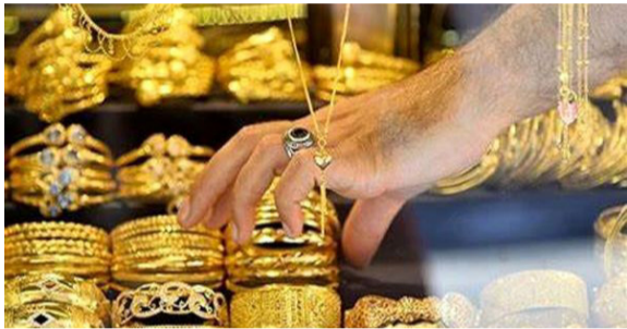
معاف شده و فقط اجرت ساخت و سود مشمول مالیات ۹ درصدی می‌شود.

باشگاه خبرنگاران جوان : ابراهیم محمد ولی، رئیس اتحادیه طلا و جواهر تهران گفت: از ۱۳ دی ماه قانون مالیات بر ارزش افزوده اجرایی و طلا از سیستم آن حذف می‌شود، اما تا این تاریخ روند معاملات به روش قبل محاسبه می‌شود. رئیس اتحادیه طلا و جواهر تهران گفت: قانون جدید مالیات بر ارزش افزوده از ۱۳ دی ماه سال ۱۴۰۰ اجرا می‌شود و توصیه ما به مردم این است که مردم طلا را گران نخرند.