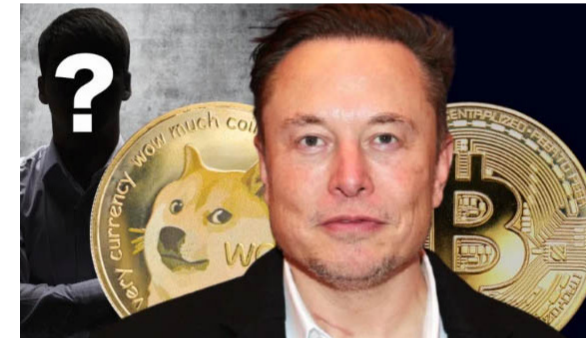
ایلان ماسک، مدیرعامل شرکت‌هایی مانند تسلا، اسپیس ایکس و نورالینک

گفت که معتقد است فردی که پشت نام مستعار ناکاموتو قرار دارد، متخصص رمزنگاری، نیک ساپو است.