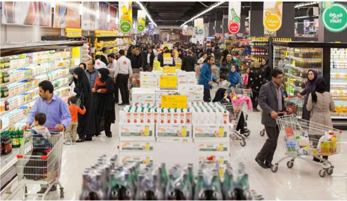
مشتریان در حال خرید از فروشگاه کالابراگ الکترونیک

آرزو برهانی – ایده روز | یکمیلیون خانوار از خرید ۱۱ قلم کالای اساسی در طرح کالابرگ الکترونیک استقبال کرده‌اند و دولت تورم تحمیل شده به این اقلام نسبت به اردیبهشت ۱۴۰۱ را با شارژ اضافی یارانه جبران می‌کند.