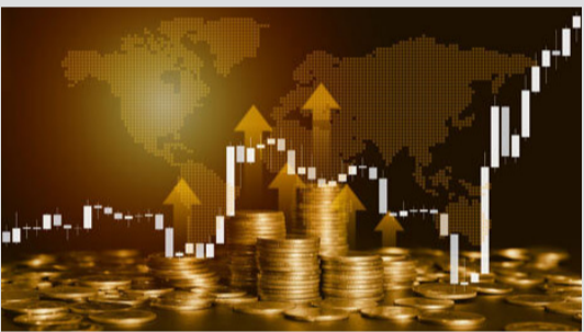
تغییرات قیمت طلا در بازارهای جهانی در ۱۰ روز اخیر

مصرف‌کننده ژوئن که هفته آینده منتشر می‌شود، باید کمتر از حد انتظار باشد. دانیل پاولوئیس، کارگزار ارشد کالا در RIO Futures گفت: اگر شاخص قیمت مصرف‌کننده ضعیف باشد و طلا نتواند رشد کند، پس فکر می‌کنم این بازار فعلاً تمام شده است و اگر طلا نتواند در چنین شرایطی رشد کند، فکر می‌کنم بازار باید با قیمت‌های پایین‌تر تثبیت شود. با این حال، برخی از تحلیلگران متقاعد نشده‌اند که تورم آماده کاهش بیشتر است. کریستوفر وکیو، رئیس معاملات آتی و فارکس درastyline.com گفت که متقاعد نشده است که تورم به هدف ۲ درصدی فدرال رزرو برسد.او افزود که اقتصاد ایالات متحده با افزایش مجدد قیمت موادغذایی و انرژی مواجه است. او گفت: من فکر می‌کنم ریسک این است که داده‌های تورم از دیدگاه فدرال رزرو حمایت می‌کند که نرخ‌های بهره باید برای