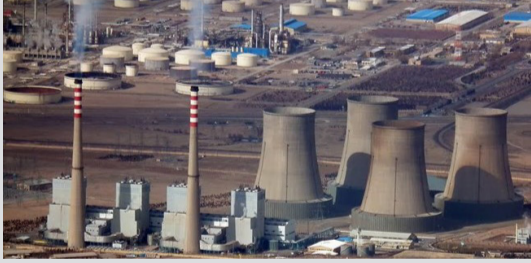
یک نیروگاه هسته‌ای در آمریکا.

بر اساس گزارش‌های دریافتی از بخش صنعت، خسارت وارده به صنعت فولاد، آلومینیوم و مس ۲۰ هزار میلیارد تومان برآورد شده است. از دیدگاهی دیگر و با درنظر گرفتن ارزش تولید از دست رفته و محاسبه حلقه به حلقه، خسارت وارده به تجزیره فولاد کشور (از کاهش تولید کنسانتره تا کاهش تولید محصولات فولادی) با در نظر گرفتن ضرایب تبدیل، به ارزش ۸ میلیارد دلار برآورد شده است.