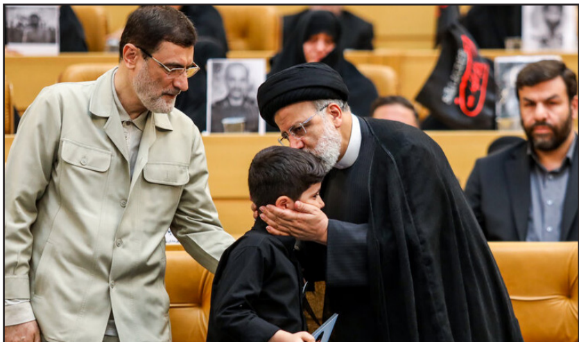
بزرگداشت شهدای مدافع حرم با حضور رئیس جمهور