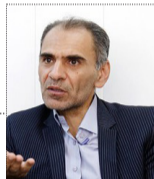
هدایت نقدینگی؛ از رویا تا واقعیت