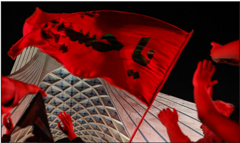
مراسم بدرقه زائران راهپیمایی اربعین در میدان آزادی