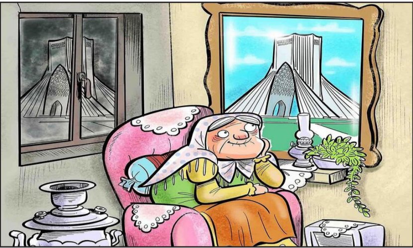
تماشای این صحنه به خاطره‌ها پیوست

شنبه ۱۴۰۰/۱۰/۱۸ - شماره ۱۲۸۱ • اذان صبح ۵:۴۵:۲۸ • طلوع آفتاب ۷:۱۴:۲۹ • اذان ظهر ۱۲:۰۱:۱۲ • غروب آفتاب ۱۷:۰۷:۳۰ • اذان مغرب ۱۷:۲۷:۳۰ • نیمه شب ۲۳:۲۶:۰۰