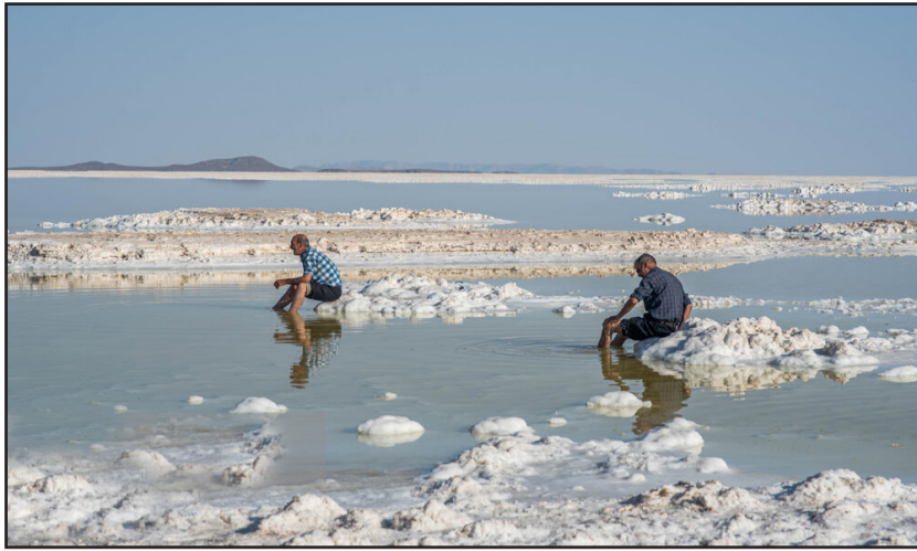
دریاچه ارومیه قربانی تغییرات اقلیمی یا محصولات پر آب بر