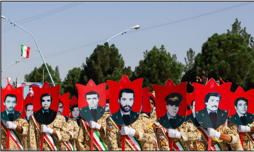
مراسم رژه نیروهای مسلح در کرمان