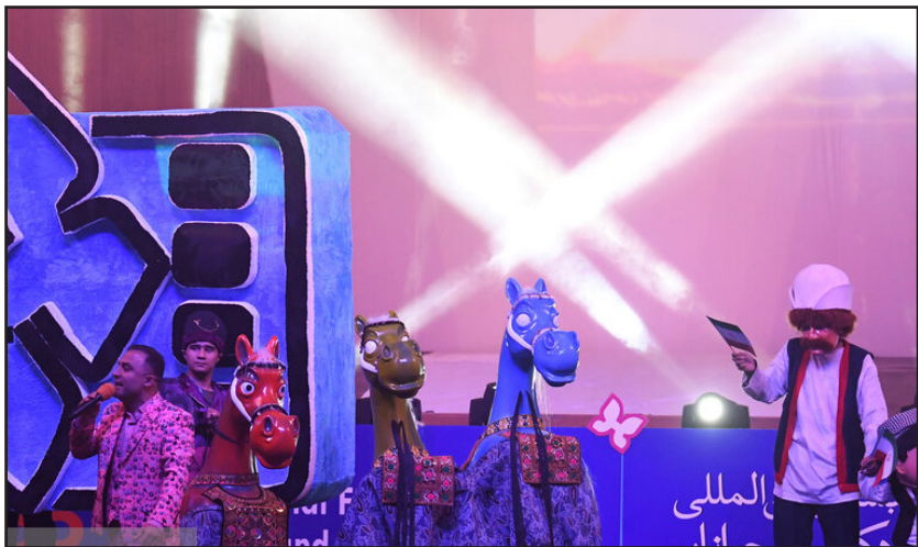
افتتاحیه‌سی و پنجمین جشنواره بین‌المللی فیلم‌های کودکان و نوجوانان