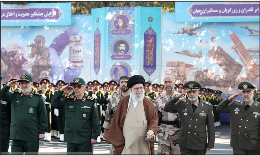
مراسم مشترک دانش آموختگی دانشجویان دانشگاه‌های نیروهای مسلح