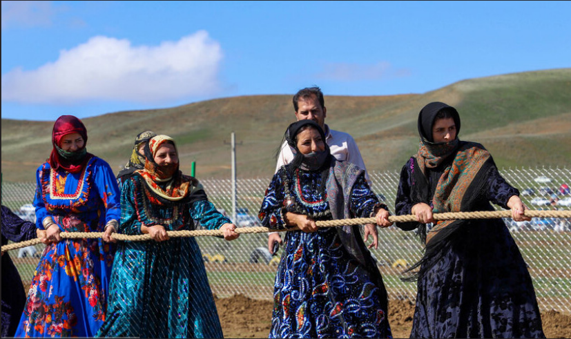
بسیست و هشتمین دوره جشنواره فرهنگی و ورزشی عشایر آذربایجان شرقی