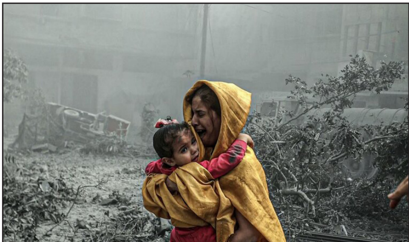
حنانات رژیم غاصب صهیونیستی در غزه