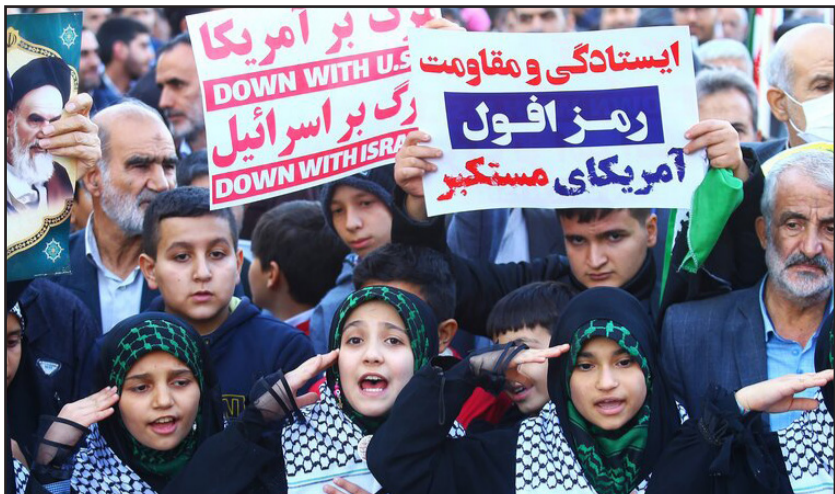
راهپیمایی مردم همدان در حمایت از کودکان و زنان مظلوم غزه