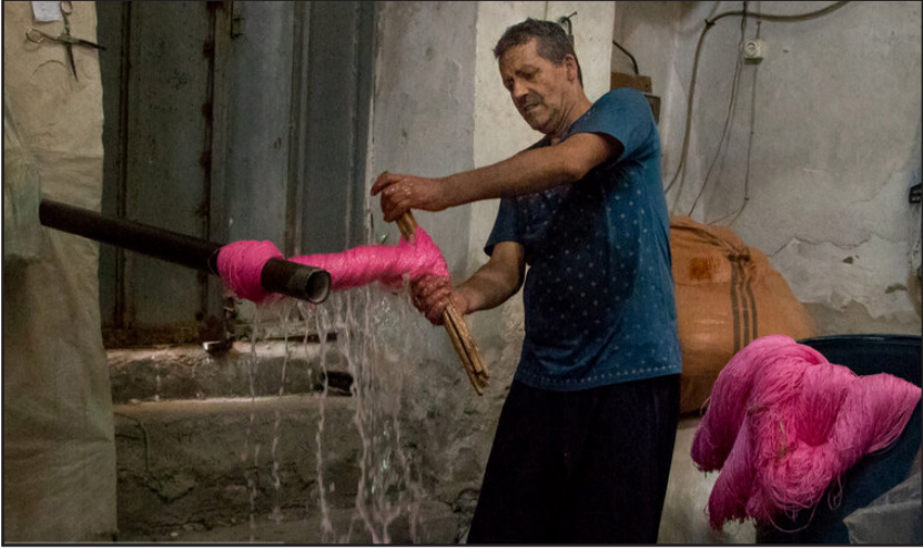
آبگیری و صاف کردن خامه‌های رنگ شده