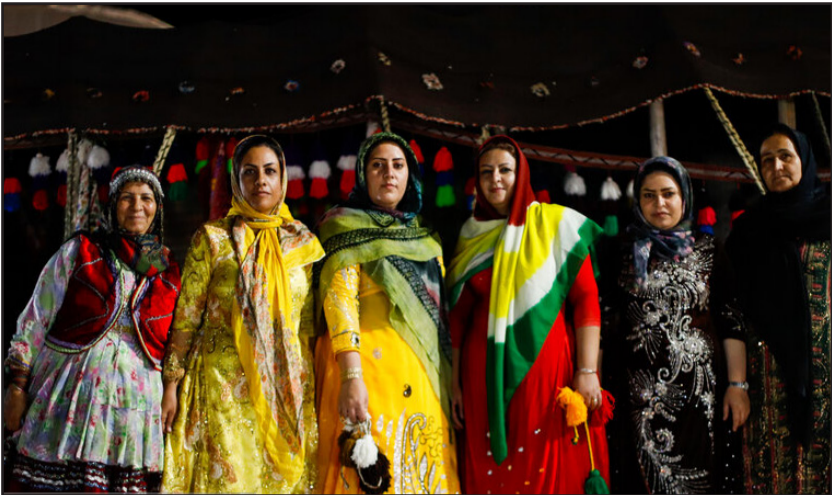
شانزدهمین جشنواره بین‌المللی اقوام ایران زمین در گرگان