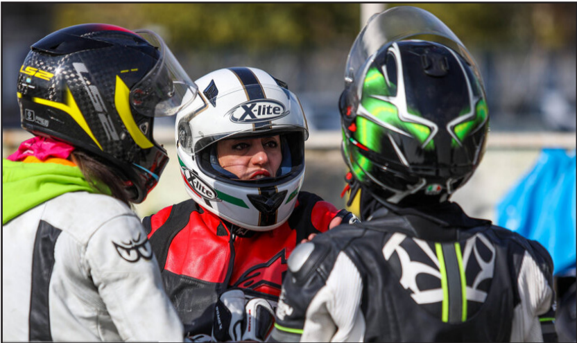
مسابقات موتورسواری سوپر بایک ایران