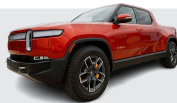
لیزینگ پیکاپ الکترونیکی در آمریکا مهیا شد

سوپارو ۳۶۰ در دسته خودروهای «کی» (Kei) قرار می‌گیرد که کوچک‌ترین خودروهای سواری بازار ژاپن هستند. به نوعی کی‌ها معادل همان سیتی کارهایی هستند که در اروپا تولید