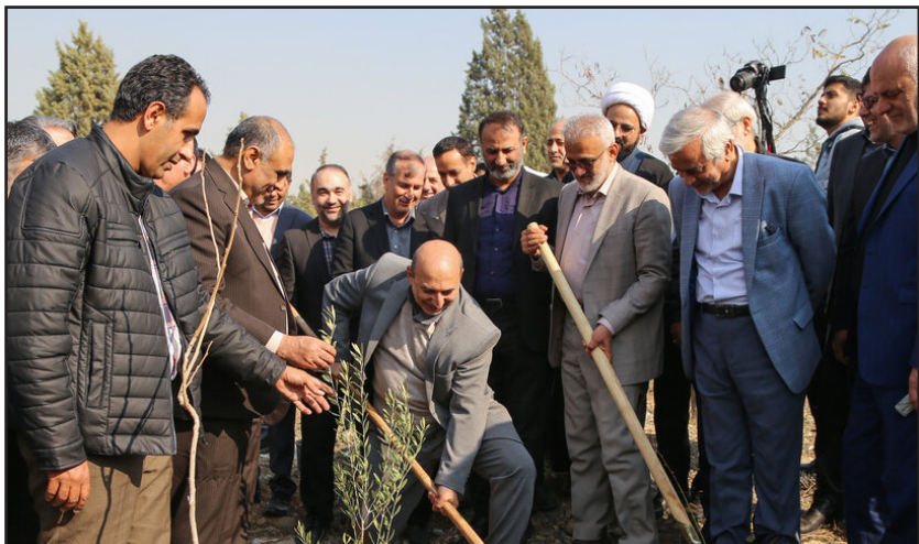
مراسم آغاز طرح سراسری کاشت یک میلیارد درخت - تهران