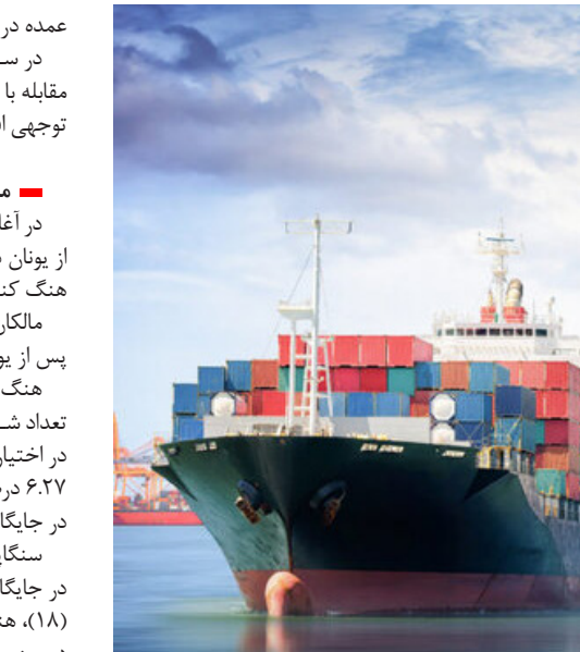
کشتی بزرگ کانتینری کوهسار در بندر چابک‌مهر

مجموله‌های فله خشک در سال ۲۰۲۲ به دلیل اختلال در صادرات اوکراین، قیمت بالای انرژی و روند در اقتصاد چین، از جمله کاهش شدید بخش املاک و مستغلات چین کاهش یافت. تقاضا برای فله‌های خشک