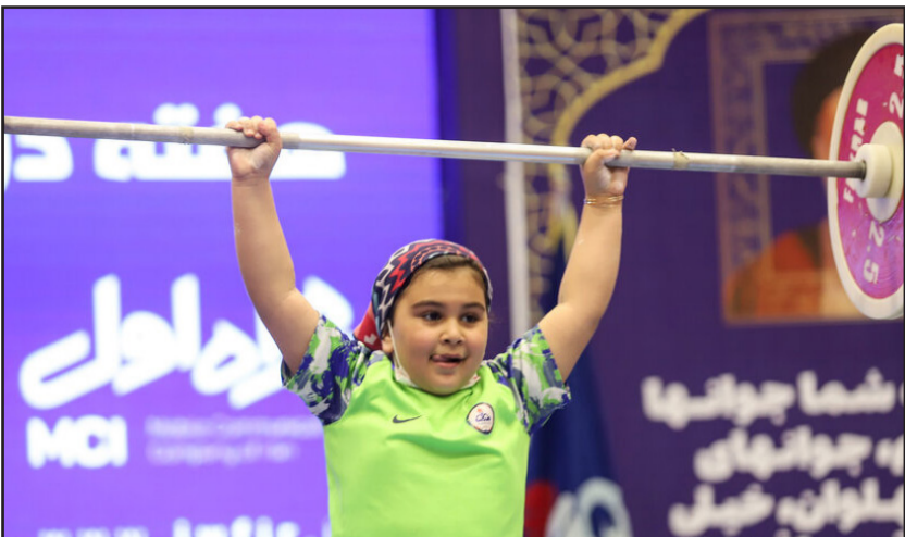
پایان هفته دوم لیگ برتر وزنه برداری در اهواز