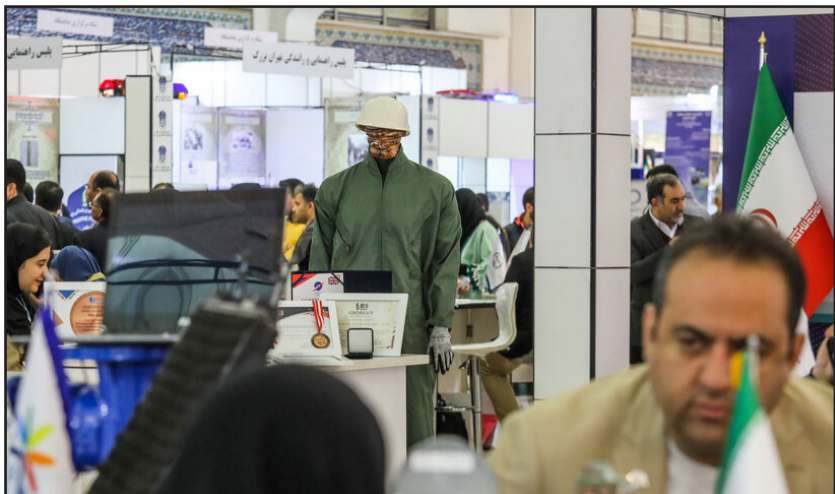
بیست و چهارمین نمایشگاه دستاوردهای پژوهش، فناوری و فن بازار