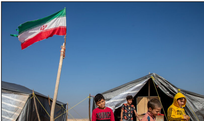
مدرسه‌ای میان عشایر