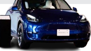
چین دست تسلا را می‌گیرد

اکسیژن‌ساز از یک برنامه برای هوشمندسازی استفاده شده است تا بین بیمار و پزشک و حتی اطرافیان بیمار ارتباط ایجاد کند، ادامه داد: در صورت تغییر در وضعیت بیمار به سرعت به آنها اطلاع داده می‌شود تا اقدامات درمانی لازم صورت گیرد. همچنین با توجه به اینکه عوامل بیماری‌زا که بیماران در معرض آنها هستند، می‌تواند مشکلات بسیاری برای آنها در پی داشته باشد، از فیلترهای نانویی حاوی نانوذرات نیز در دستگاه اکسیژن‌ساز استفاده شده تا عوامل بیماری‌زا از بین بروند.