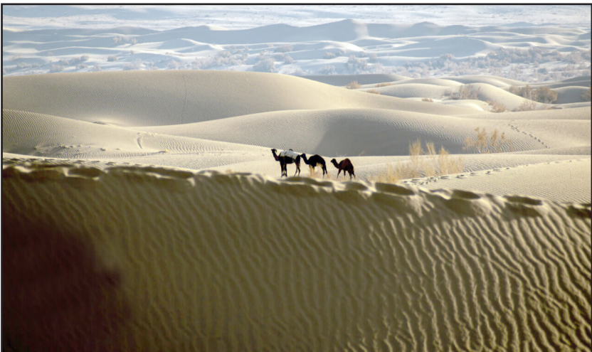
کوبیر مصر ایران، زیبا و در دسترس