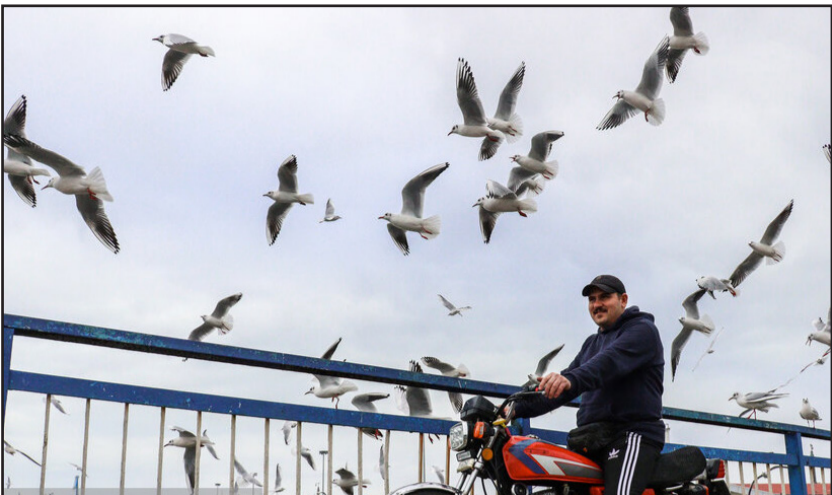
ککابی های بندر انزلی