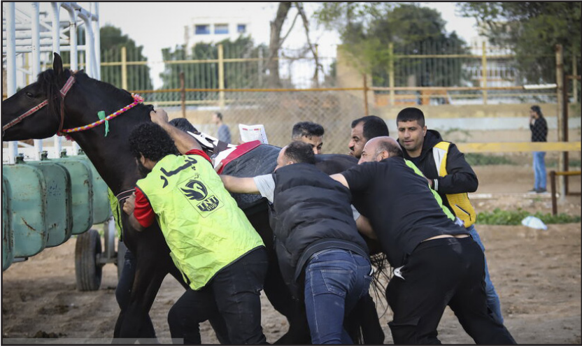
هفته اول مسابقات کورس اسب‌دوانی کشور در اهواز