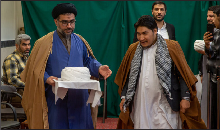
عمامه گذاری طلاب در روز عید مبعث - قم