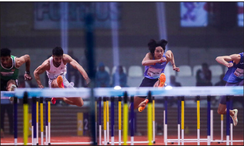
افتتاحیه مسابقات دوومیدانی داخل سالن قهرمانی آسیا