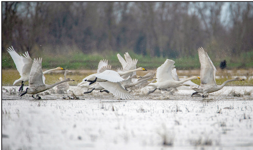
قوهای مهاجر در تالاب سرخ رود