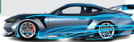
فورد ترمز کشید

شرکت خودروسازی فورد ارسال خودروهای برقی جدید لاینیتینگ ۴۱۵۰ را متوقف می‌کند. فورد موتور اعلام کرد که ارسال تمام وانت‌های برقی ۴۱۵۰ لاینیتینگ مدل سال ۲۰۲۴ را متوقف کرده است، بنابراین می‌تواند برای مشکلی که مشخص نکرده است، بررسی‌های کیفیتی را انجام دهد. خودروساز شماره دو ایالات متحده اعلام کرد که توقف محموله