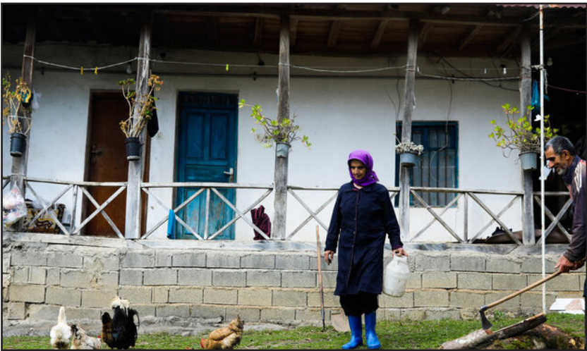
زندگی روستایی در لفور سوادکوه