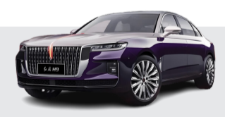
ونگچی H9 مدل ۲۰۲۴ با بهبود طراحی و افزایش قدرت رونمایی شد

البته شاید سازند چینی با این کار قصد داشته راننده بهتر صدای پیش‌رانه ۱.۵ لیتری توربوشارژر که زیر کاپوت قرار دارد را بشنود! این موتور که ۱۶۷ اسب بخار قدرت و ۲۷۰ نیوتون متر گشتاور تولید می‌کند، به یک گیربکس هفت سرعته دوکلاچه متصل است. گک برای امپو S پدال‌های تعویض دنده پشت فرمان و سیستم‌اگزوز متغیر را هم در نظر گرفته که صدای غرش جذابی تولید می‌کند تا جایی که در اکثر طول رانندگی، اگزوز متغیر را در حالت صدای بلند گذاشتیم