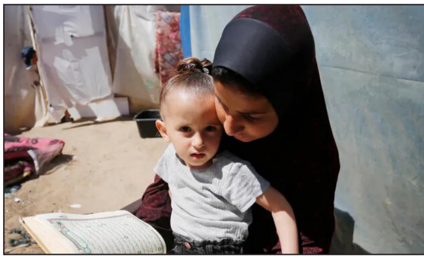
شش ماهه ویرانی در جنگ صهیونیست‌ها علیه غزه